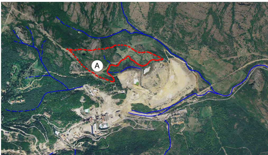
Inquadramento dell'area di intervento e del bacino imbirifero a monte (in rosso)